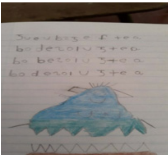
Figura 2. Cuaderno de lenguaje de un estudiante con discapacidad.

También, los docentes mencionaron en la entrevista que las adecuaciones curriculares que han realizado en los programas son con el objetivo de procurar que los estudiantes con discapacidades avancen, respetando su ritmo de aprendizaje. Otra variante en el aula es el trabajo en equipo que permite fomentar la colaboración entre los estudiantes. Otro docente comentó que hace uso del modelado porque es más práctico para ellos.